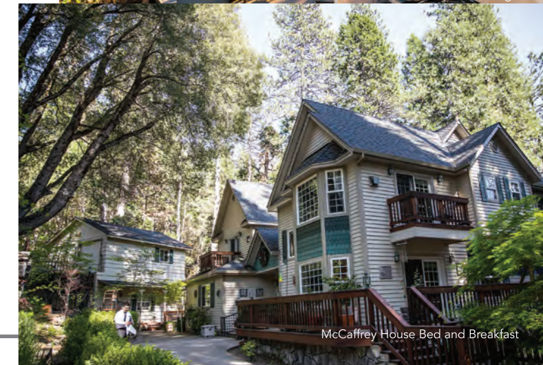
McCaffrey House Bed and Breakfast