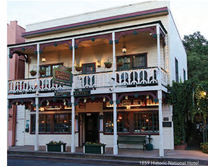
1859 Historic National Hotel

Consulter les hébergements disponibles sur VisitTuolumne.com .